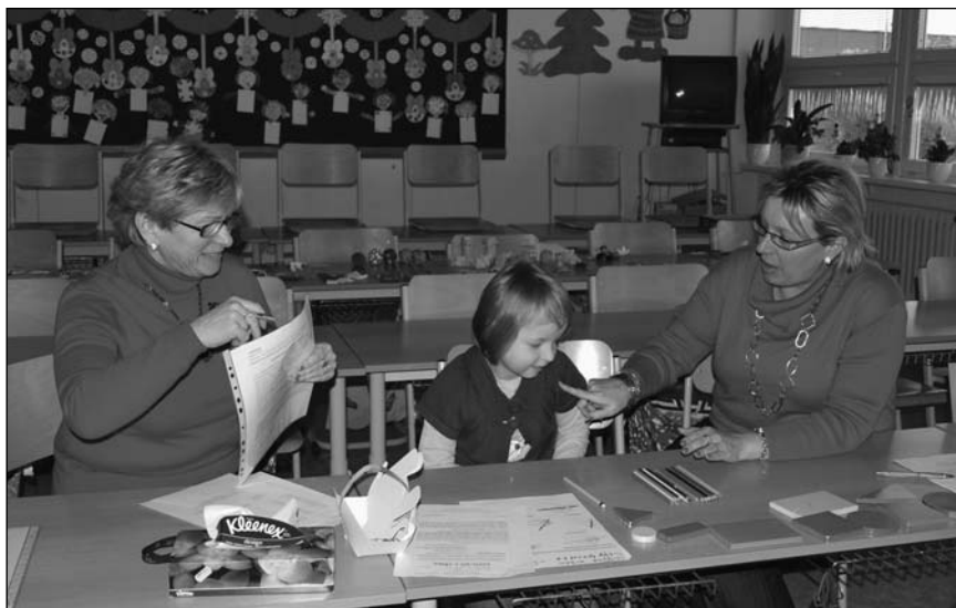
Zápis do 1. třídy