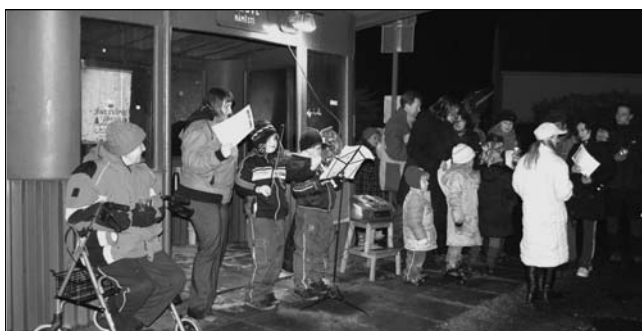
Vánoční zpívání na Vápensku