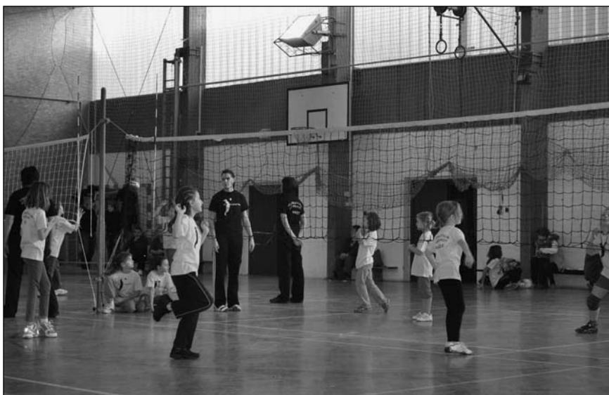
18. prosince se konal volejbalový turnaj dětí

13. Zápis do 1. ročníku proběhl v pondělí 30. 1. 2012. Novela školského zákona platná od 1. 1. 2012 mj. zprísňuje pravidla pro odklady školní docházky. Pro OŠD je třeba doložit doporučení školského poradenského zařízení a odborného lékaře nebo klinického psychologa, znovu jsou po letech tedy nutné oba doklady současně. Dále Školský zákon č. 561/2004 Sb., ve znění k 1. 1. 2012 § 183, odst. 2 ukládá povinnost škole, že rozhodnutí, kterým se vyhovuje žádosti o přijetí ke vzdělávání, se oznamují zveřejněním seznamu uchazečů pod přiděleným registračním číslem s výsledkem řízení u každého uchazeče. Seznam se zveřejňuje na veřejně přístupném místě ve škole ( hlavní vchod ) a v případě základní školy též způsobem umožňujícím dálkový přístup ( www.skolakostomlaty.cz ), a to alespoň na dobu 15 dnů, obsahuje datum zveřejnění. Zveřejněním seznamu se považují rozhodnutí,