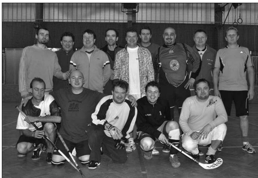
Vánoční víceboj se konal v hale BIOS 28. prosince.